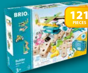
34591 Builder Motor Set