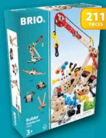
34588 Builder Activity Set

WARNING! Not suitable for children under 3 years due to small parts. Choking hazard! ADVARSEL! Uegnet for barn under 3 år på grunn av små deler. Kvelningsfare! VAROITUS! Ei sovelu alle 3-vuotiaille lapsille. Sisältää pieniä osia. Tukehtumisvaara! ADVARSEL! Ikke egnet for barn under 3 år pga. smådele. Kvelningsfare! WARNING! Inte lämplig för barn under 3 år pga. smådelar. Kvävningssrisk! ATTENTION! Ne convient pas aux enfants de moins de 3 ans – contient des petits éléments. Risque d'étouffement! ¡AVISO! No adecuado para niños menores de 3 años porque contiene piezas pequeñas. Riesgo de asfixia! ACHTUNG! Wegen der kleinteile nicht für Kinder unter drei Jahren geeignet. Erstickungsgefahr! ATTENZIONE! Non adatto a bambini al di sotto di 3 anni a causa della presenza di piccole parti. Rischio di soffocamento! WAARSCHUWING! Met het oog op kleine onderdelen niet geschikt voor kinderen tot 3 jaar. Verstikkingsgevaar! ADVERTENCIA! Não adequado para crianças com menos de 3 anos porque contém peças pequenas. Risco de asfixia! VAROVANIE! Z dôvodu malých súčastí nie je vhodné pre deti mladšie ako 3 roky. Riziko udusení! OSTRZEŻENIE! Produkt zawiera małe części i jest nieodpowiedni dla dzieci poniżej 3 roku życia. Ryzyko zadławienia! VAROVÁNÍ! Nevhodné pro děti do 3 let – obsahuje drobné součásti. Nebezpečí udušení! 注意! 誤飲の危険がありますので、3才未満のお子様には絶対に与えないで下さい。窒息などの危険があります。