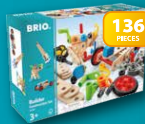
34587 Builder Construction Set